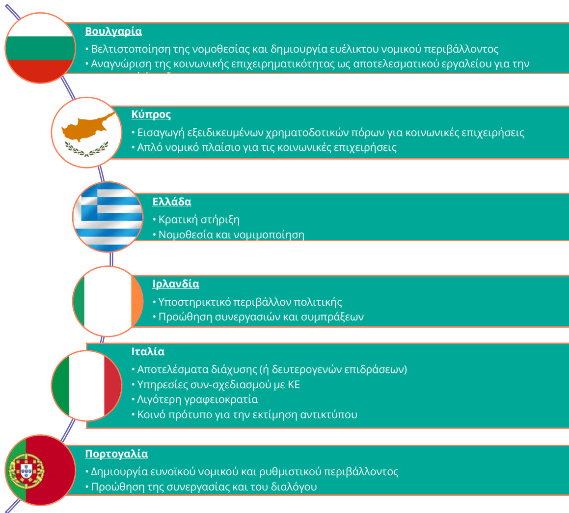
Σχήμα 4. Συστάσεις για υπεύθυνους/-ες χάραξης πολιτικής