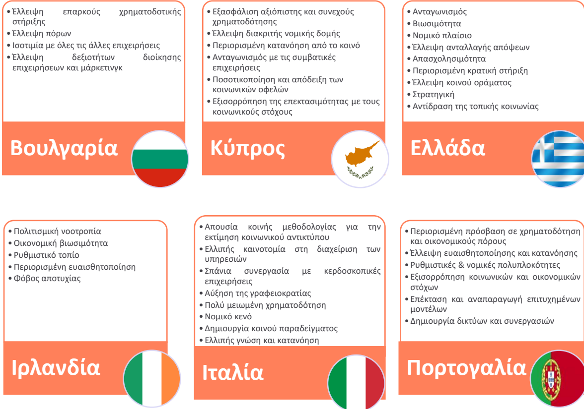
Σχήμα 2. Προκλήσεις για τις κοινωνικές επιχειρήσεις