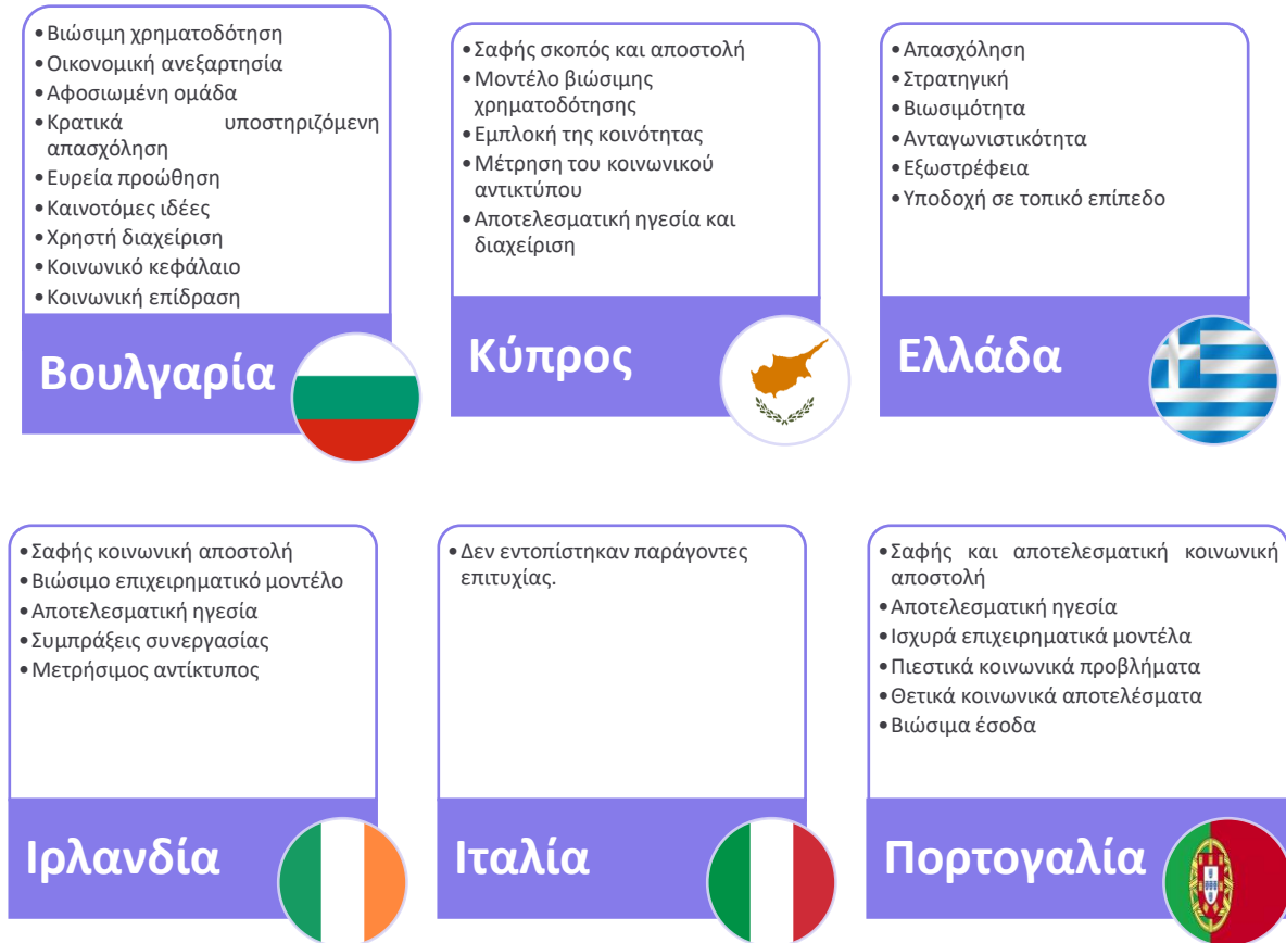
Σχήμα 1. Παράγοντες που επηρεάζουν την επιτυχία μιας κοινωνικής επιχείρησης

βιώσιμο σύστημα καλλιέργειας και παρέχει ευκαιρίες απασχόλησης σε άτομα με αναπηρία. Τα προϊόντα του Cogumelo χαίρουν μεγάλης εκτίμησης στην αγορά, διότι προωθούν την περιβαλλοντική βιωσιμότητα και την κοινωνική ένταξη.