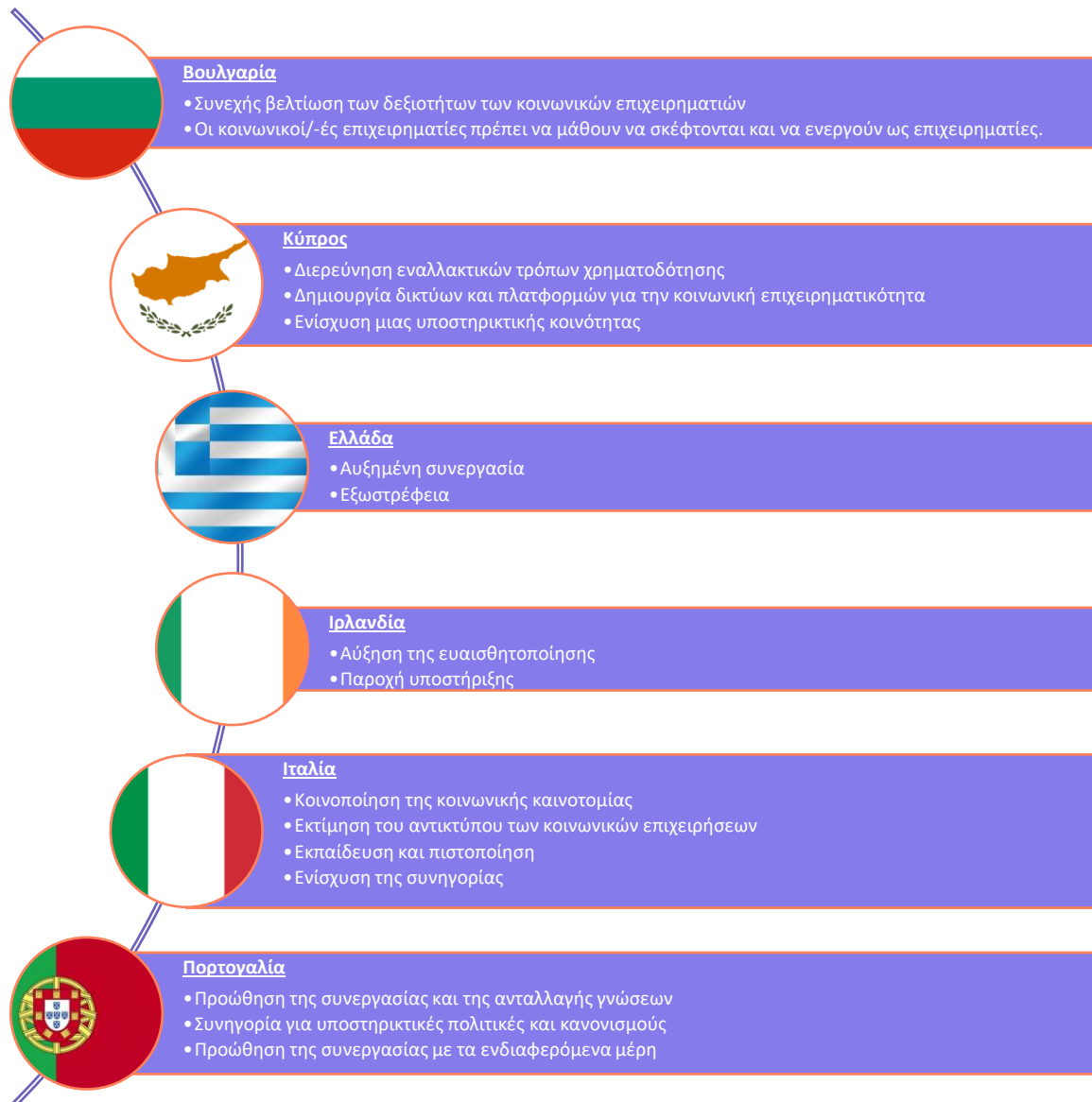
Σχήμα 3. Συστάσεις για επαγγελματίες