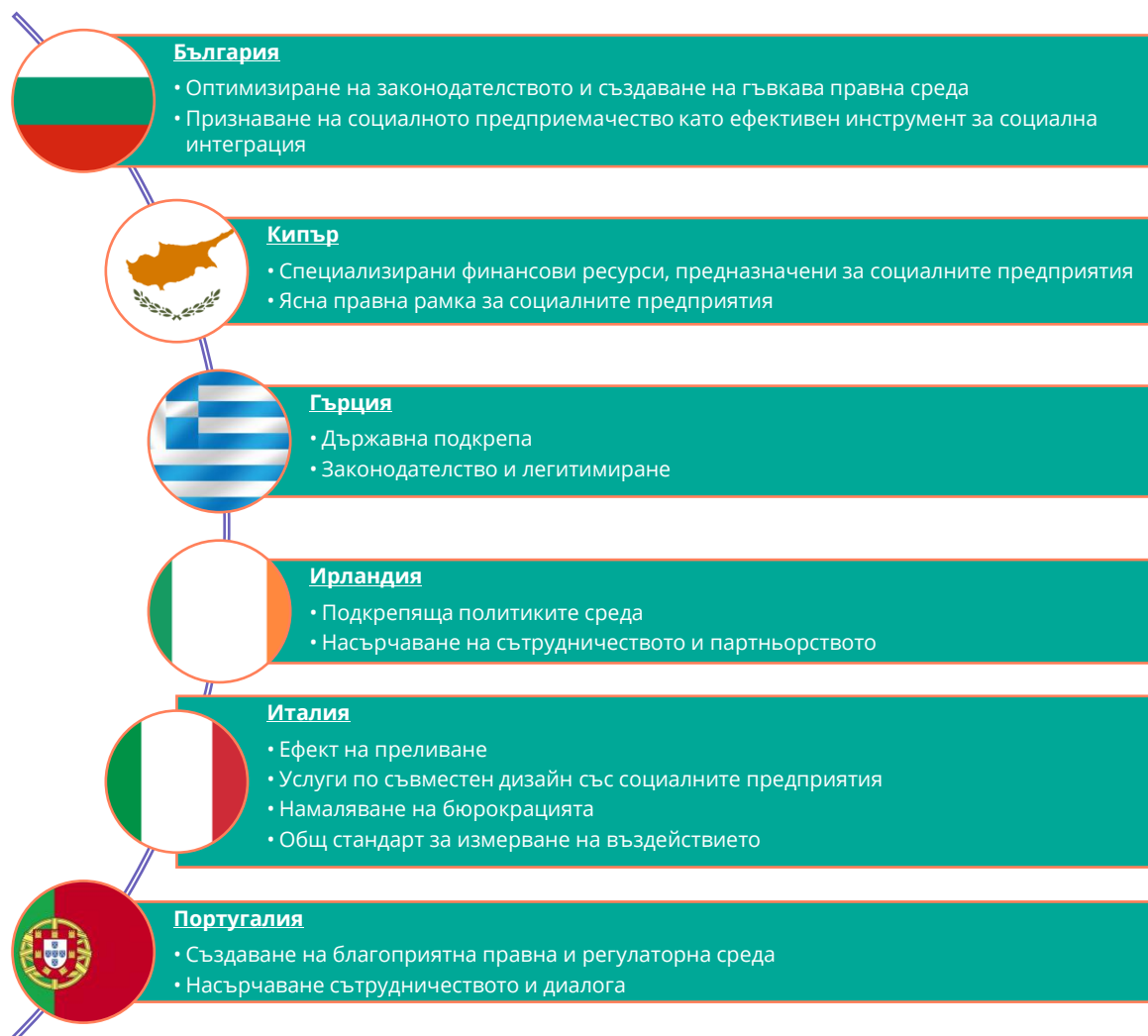
Фигура 4. Препоръки за създателите на политики

Насърчавайки сътрудничеството и диалога, политиките могат да създадат екосистема, която подхранва иновациите, стимулира социалното въздействие и дава възможност на социалните предприемачи да процъфтяват. Този подход не само води до разработването на ефективни политики и разпоредби, но също така създава солидна основа за стабилен растеж и устойчивост в сектора на социалното предприемачество. Page | 46