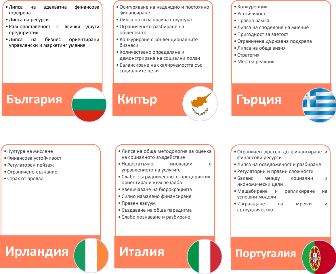
Фигура 2. Предизвикателства пред социалните предприятия